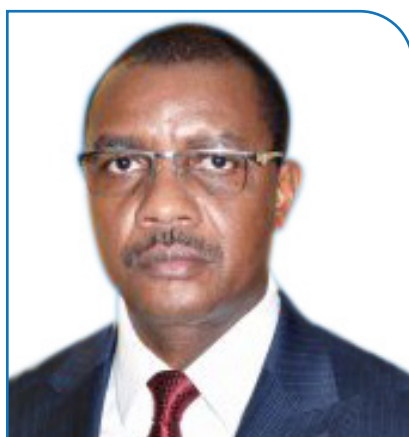
M. Gabriel DODO NDOKE Ministre des Mines, de l'Industrie et du Développement Technologique, Vice-Président du Comité ITIE