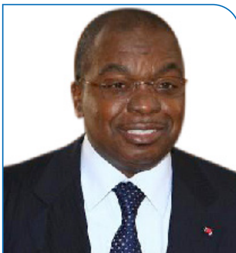
M. Louis Paul MOTAZE Ministre des Finances, Président du Comité ITIE