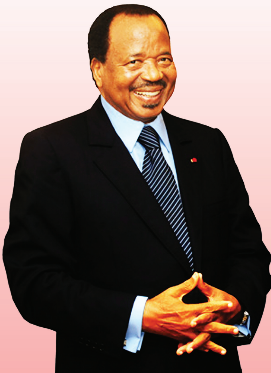
S.E. M. PAUL BIYA Président de la République du Cameroun