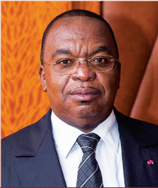
Ministre des Finances, Président du Comité ITIE M. Louis Paul MOTAZE