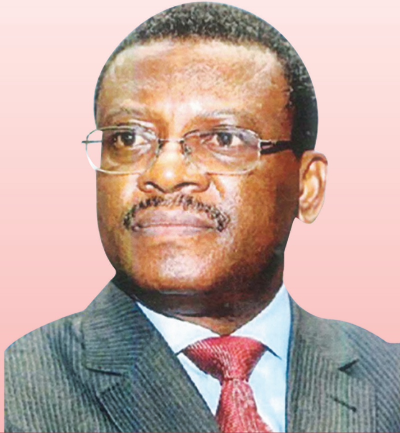
Premier Ministre, Chef du Gouvernement M. Joseph DION NGUTE