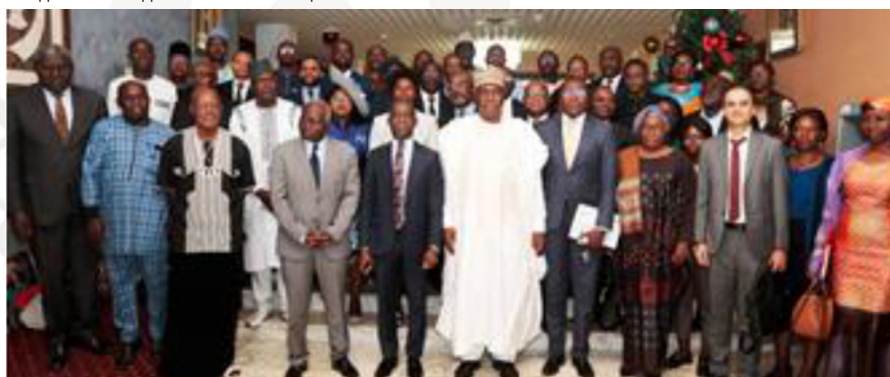
Photo de famille des membres du gouvernement, des personnalités, des membres du Comité ITIE présents à l'atelier