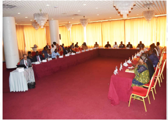
Une vue d'ensemble de la salle et participants ayant pris part à la session d'adoption du Rapport ITIE 2020, le 15 décembre 2022, à l'hôtel Mont Fébé de Yaoundé

▫ Etat de la publication des comptes rendus et feuilles de sessions sur le site internet du Comité ITIE http://eitcameroon.org/download/cr-de-latelier-de-presentation-au-public-du-rapport-itie-2020-pdf/