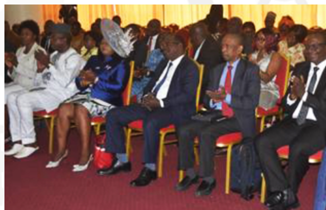
Une attitude des participants à l'atelier de présentation au public du Rapport ITIE 2020.