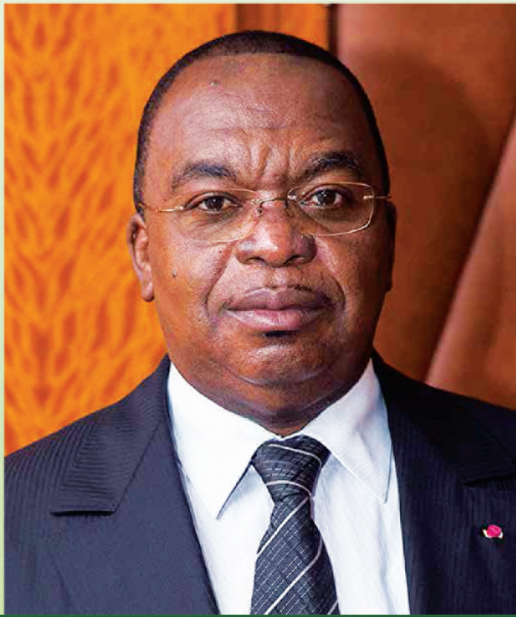
Ministre des Finances, Président du Comité ITIE M. Louis Paul MOTAZE