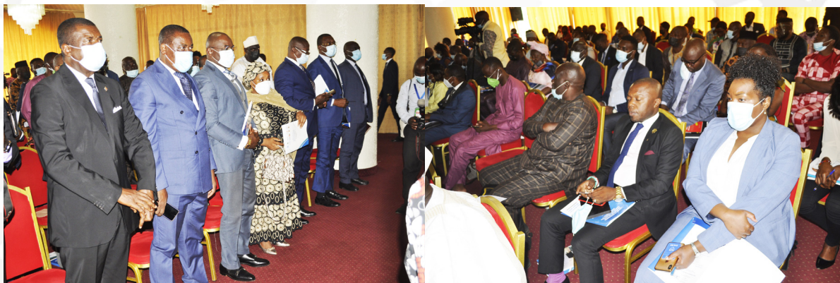
Une attitude des participants à l'atelier de présentation au public du Rapport ITIE 2018.