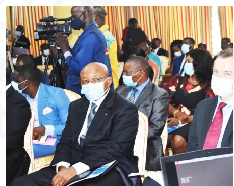
Une attitude des participants à l'atelier de présentation au public du Rapport ITIE 2019.