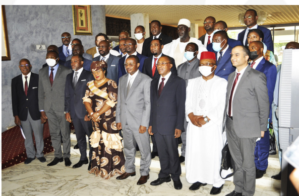
Photo de famille des membres du gouvernement, des personnalités, des membres du Comité ITIE présents à l'atelier.