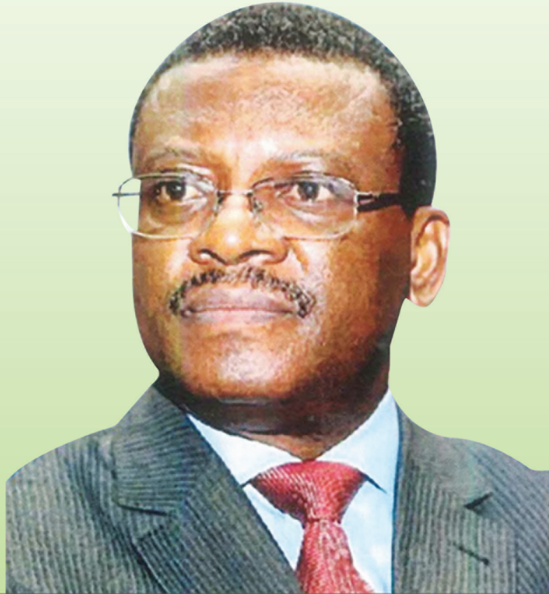
Premier Ministre, Chef du Gouvernement M. Joseph DION NGUTE