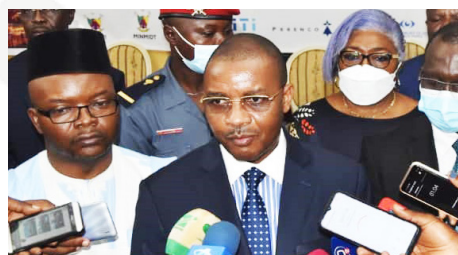
Le Ministre des Mines répondant aux questions des journalistes autour du Rapport ITIE 2019.