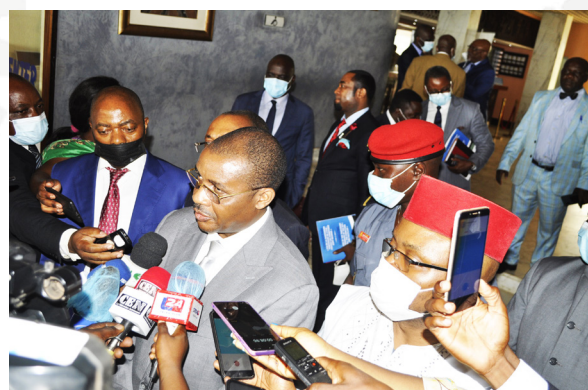
Le Ministre des Mines, Vice-président du Comité ITIE interviewé par les journalistes à l'issue de l'atelier.