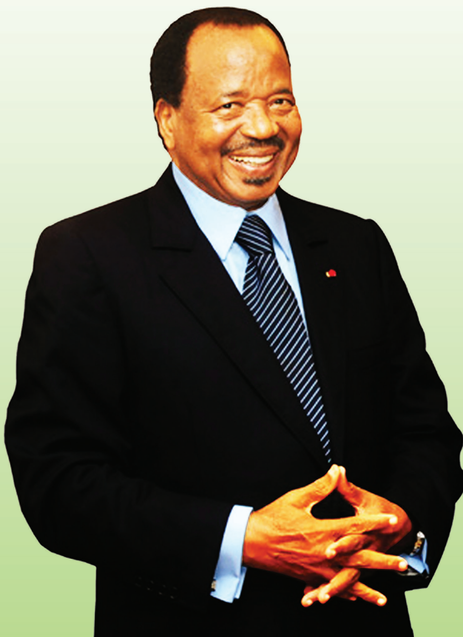
S.E. M. PAUL BIYA Président de la République du Cameroun